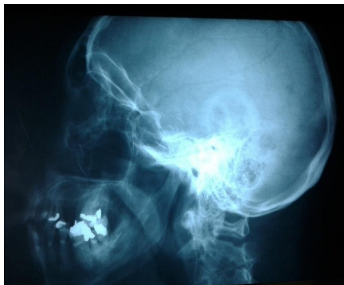
Figura 1. Radiografía lateral de cráneo

Se procedió a la realización de RX anteroposterior y lateral de cráneo (Figura 1) y Tomografía Axial Computarizada (Figura 2,3), para corroborar diagnóstico y posible etiolog.